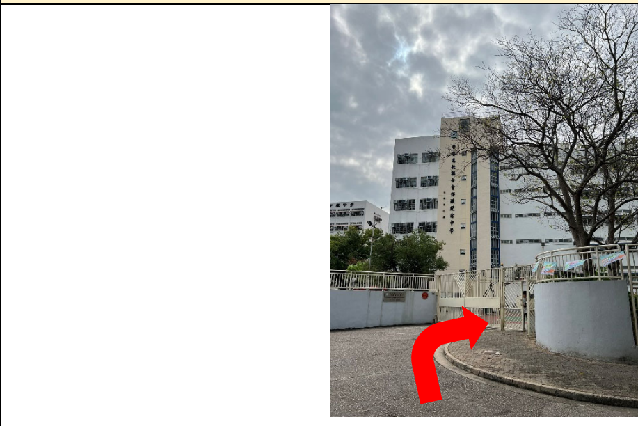
a. 沿路前行到达港岛及九龙选区票站